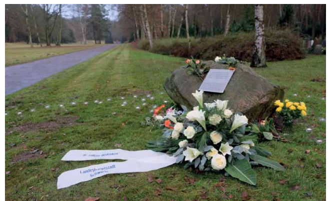
Gedenkstein auf dem Waldfriedhof (2016)

Der Autor dieses Artikels (Matthias Baerens) arbeitet mit Unterstützung der Bundesstiftung Aufarbeitung an einem Buch über den Flugzeugabsturz 1986 und seine Folgen. Mehr Informationen dazu gibt es hier: www.absturz1986.de .