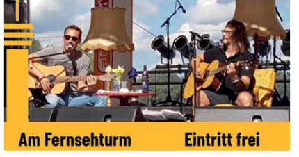
Am Fernsehturm Eintritt frei