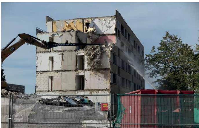
Der Abriss in Neu Zippendorf Mitte schreitet mit großen Schritten voran

Der Turmblick wird Sie über den weiteren Planungsprozess aktuell informieren.