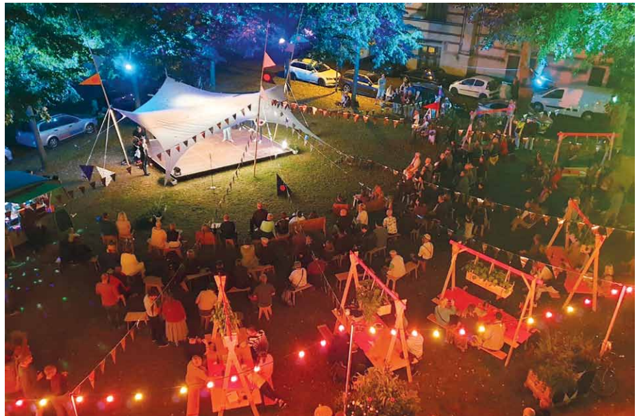
KUNSTRASEN Open Air im September am Ekhofplatz

Und bei „Theater verbindet“ komme ich ins Spiel. Ich bin Regisseurin am Haus und interessiere mich besonders für die Stadt als Bühne und die Bürger:innen als Mitwirkende. Ich möchte die Gelegenheit nutzen, mich Ihnen vorzustellen, weil ich bereits ab jetzt nicht nur in der Stadt, sondern auch „oben“ präsent sein