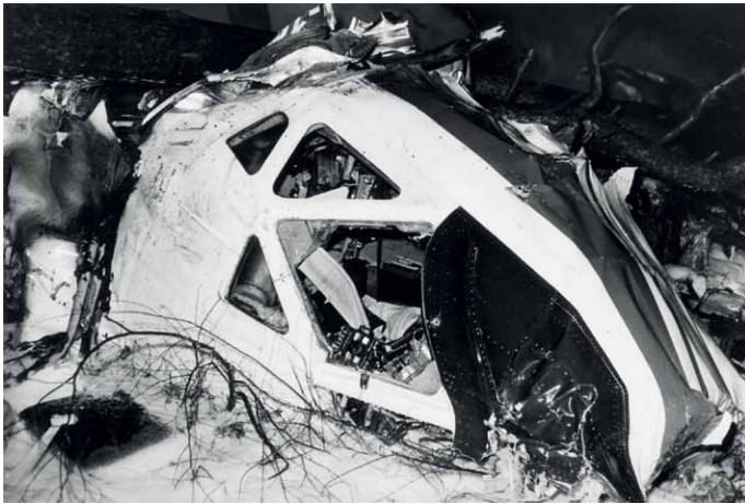
Aufnahme von der Unfallstelle

Eine Klassenfahrt der Ernst-Schneller-Oberschule endet mit einem Flugzeugabsturz