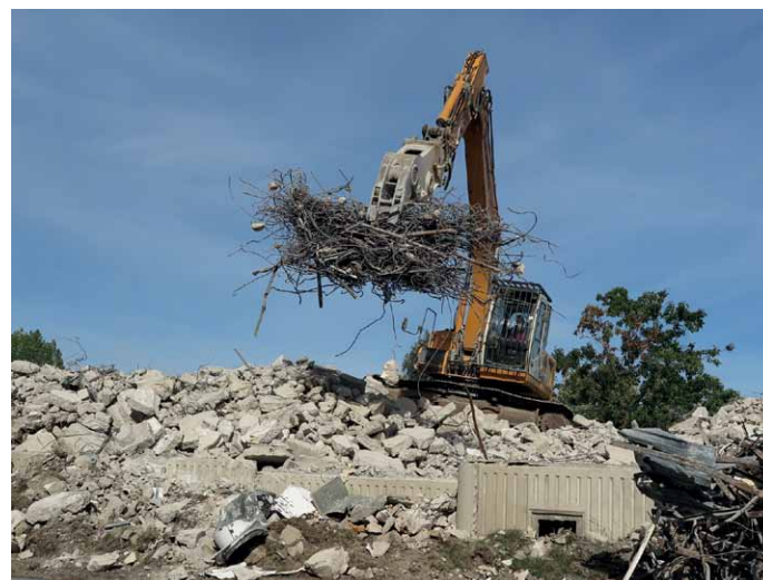
Fachgerechte Trennung des Bauschutts