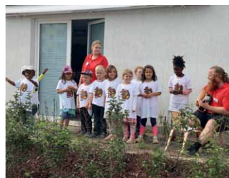
Kinder der Kita Igelkinder singen zur Eröffnung