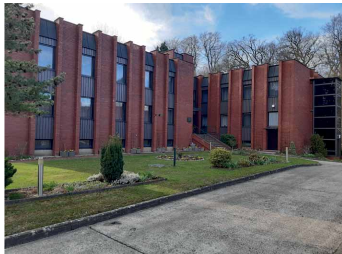
Kloster „Maria Frieden“